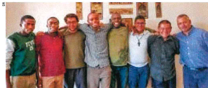
Les séminaristes en formation à Kibera.